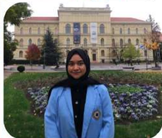
Student Mobility, Kuliah Kerja Lapangan Mahasiswa FEB UNISBA