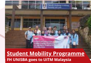
Student Mobility Programme FH UNISBA goes to UiTM Malaysia

Kehidupan akademik di Fakultas Hukum Universitas Islam Bandung dibangun melalui proses pembelajaran yang aktif, kritis, dan berorientasi pada penguatan analisis hukum serta etika profesi. Mahasiswa terlibat dalam berbagai kegiatan akademik seperti diskusi ilmiah, seminar, kuliah tamu praktisi, dan peradilan semu sebagai bagian dari pengembangan kompetensi keilmuan dan praktik.