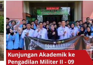
Kunjungan Akademik ke Pengadilan Militer II - 09