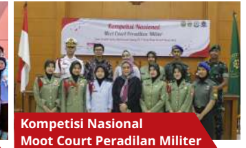
Kompetisi Nasional Moot Court Peradilan Militer